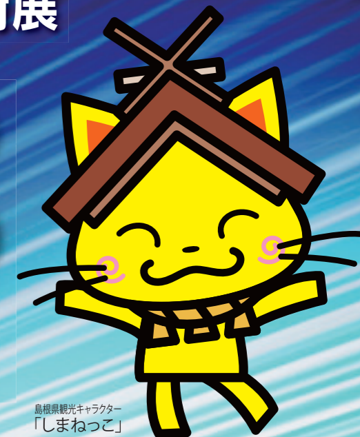
島根県観光キャラクター 「しまねっこ」