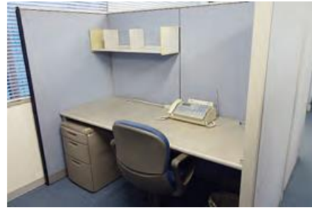
レンタルオフィス（ブース）