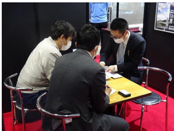
名古屋機械要素技術展