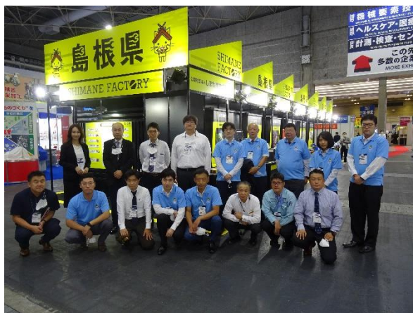
関西機械要素技術展