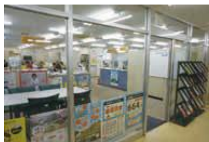
「いわみぷらっと」入り口