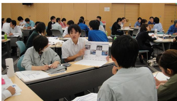
《工場管理実践塾の様子》