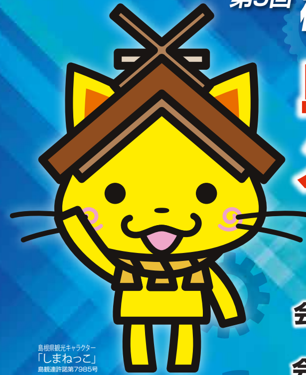
島根県観光キャラクター 「しまねっこ」 鳥取県庁第7985号