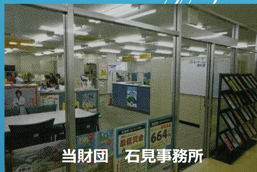
当財団 石見事務所

平日 9:00~17:00 土日祝日 9:00~17:00 ※但し、土日祝日は電話対応のみ