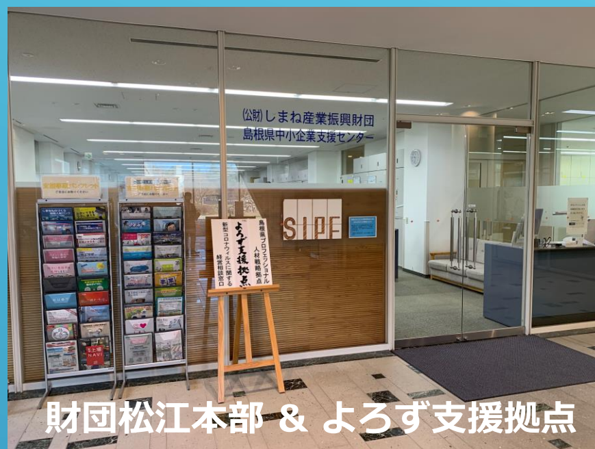
財団松江本部 & よろず支援拠点

公益財団法人 しまね産業振興財団 経営支援課 [松江本部] TEL:0852-60-5115 〒690-0816 島根県松江市北陵町1番地 テクノパークしまね内 FAX: 0852-60-5105