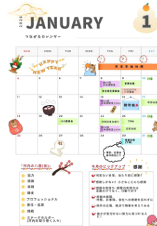
当社社内カレンダー

当事者意識が大きく向上した。全体集会上には財団職員も同席し、第三者の視点から策定の意義を説明することで、組織全体への周知を補完した。