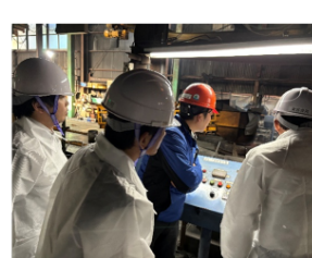
先進企業視察の様子

提案した内容の中から、以下の取組を支援 ②-1 月次定例会議の開催（経営情報の共有と行動方針の検討）