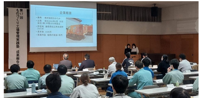
工場管理実践塾 成果報告会（R8.1.28開催）