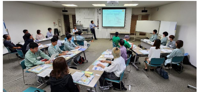
工場管理実践塾第1回 松江会場（R7.7.2開催）